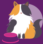
Controllo del peso