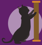
Gatti da appartamento